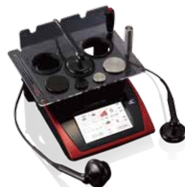
使用機器：フィジオ ラジオスティム