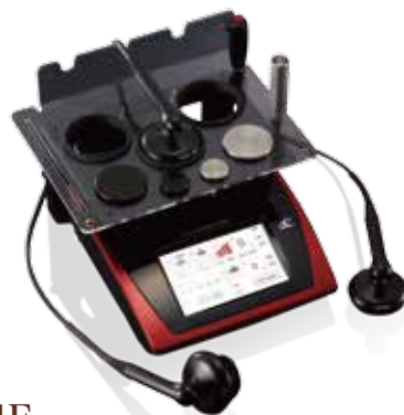
使用機器：フィジオ ラジオスティム

録音、写真・ビデオ撮影などは一切禁止させていただいております。予めご了承ください。